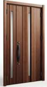
商品画像はイメージです。

工事総額450,000円(玄関ドア本体・取替工事・廃棄費用の目安、消費税込)を想定。オールLIXIL無金利リフォームローンキャンペーン適用、頭金0円、割賦元金450,000円、60回均等払いを想定した試算金額となります。実際の金額とは異なりますので、詳細につきましてはお尋ねください。