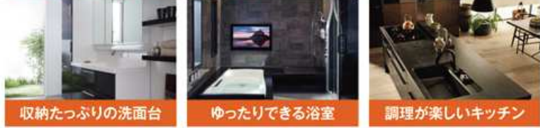
収納たっぷりの洗面台